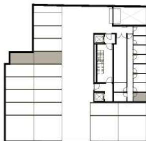
GARAGEM + ARRUMOS (PISO -2)