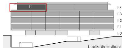
Localização em Alçado