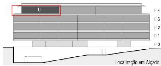
Localização em Alçado